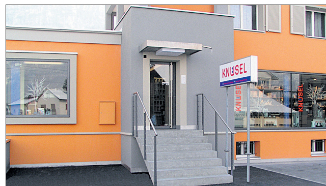
Knüsel Elektro in Stans