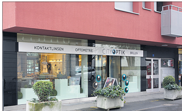
City Optik in Stans

Der Architekt spielt eine entscheidende Rolle bei der