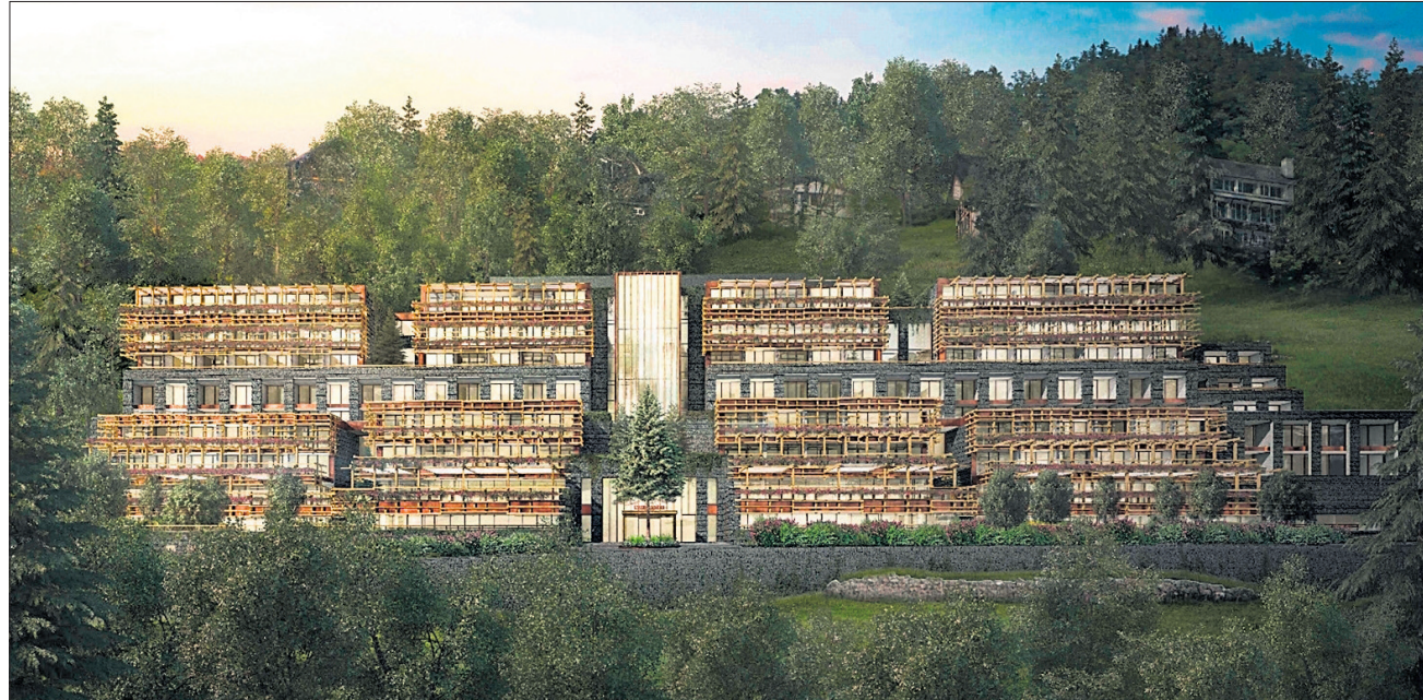
Bürgenstock Healthy Living – © Matteo Thun & Partners

Sport Schuh Fitting GmbH 6374 Buochs • Tel. 041 620 67 76 www.sportschuhfitting.ch (Sommer: Mo + Do geschlossen)