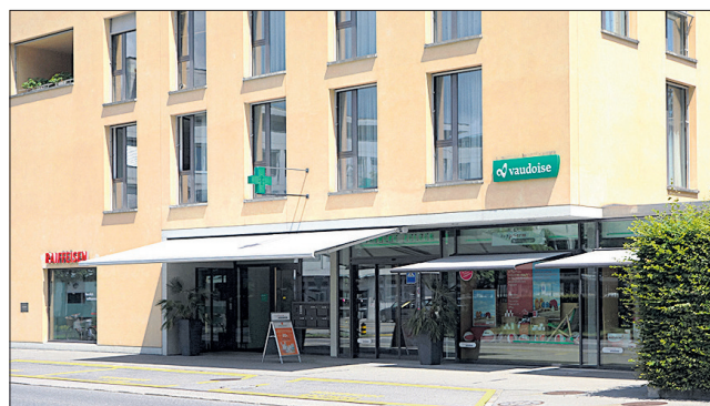
Zelger Apotheke in Stans